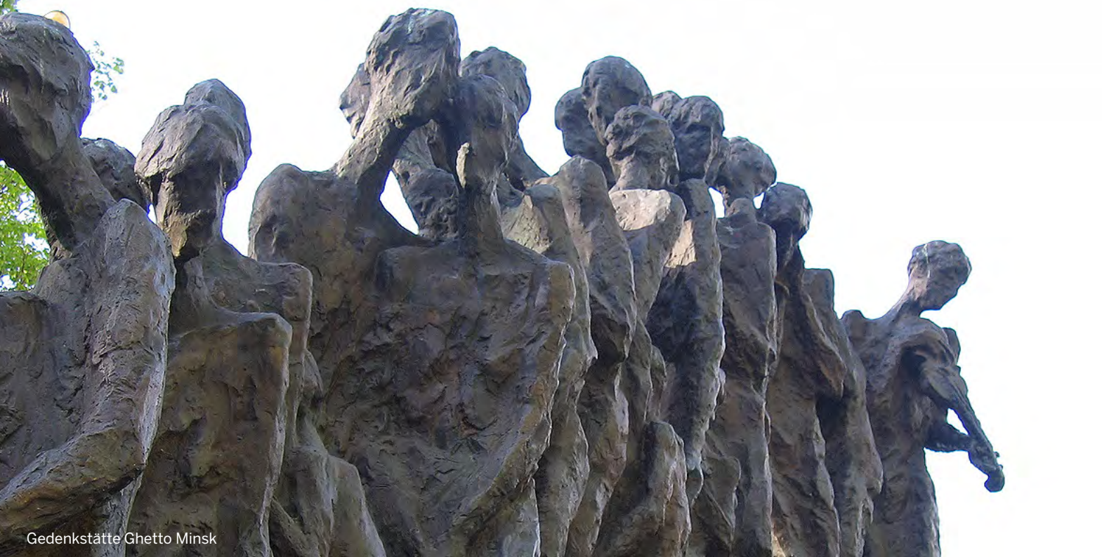
Gedenkstätte Ghetto Minsk

Der Künstler und Architekt Leonid Lewin hat die bedeutendsten Gedenkorte in Belarus gestaltet. Sein Werk spricht Menschen aus Ost- und Westeuropa in gleicher Weise an.