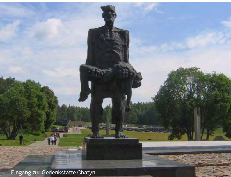
Eingang zur Gedenkstätte Chatyn